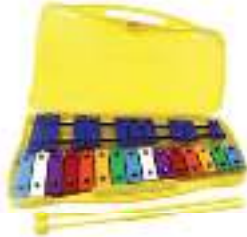
Metalófono 25 Placas