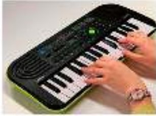
Teclado 32 teclado

Se solicita dentro de lo posible que los estudiantes puedan contar con su propio instrumento musical, aquí van las siguientes opciones: