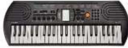
Teclado 44 teclado